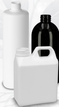
Flaschen und Kanister